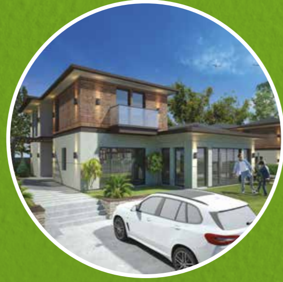
Tip 2 Villa