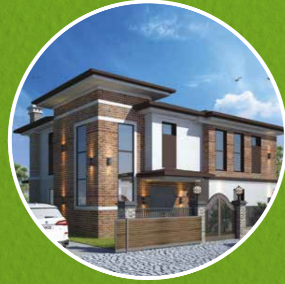
Tip 3 Villa