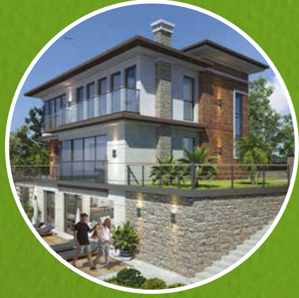
Tip 1 Villa